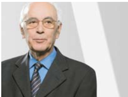
Dr. Hans Friderichs Vorsitzender des Aufsichtsrats

BERICHT DES AUFSICHTSRATS Sehr geehrte Aktionärinnen und Aktionäre, das Geschäftsjahr 2007 war für den adidas Konzern erneut sehr erfolgreich. Dies ist gleichzeitig Herausforderung und Ansporn, die strategischen Unternehmensziele weiterhin kontinuierlich und konsequent umzusetzen. Die in 2008 anstehenden großen Sportereignisse und aufregende neue Produkteinführungen werden dazu beitragen, dass unsere Marken ihre weltweiten Marktpositionen weiter ausbauen können.